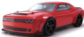
ダッジチャレンジャー No.IGB160