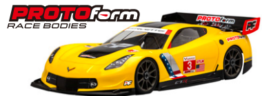
シボレー コルベット C7.R (GT2/1546-40) No.612061C