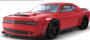
ダッジチャレンジャー No.IGB160