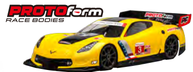
シボレー コルベット C7.R (GT2/1546-40) No.612061C