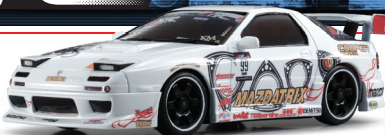
NEW RX-7FC No.99 カイル・モーハン レーシング No.30578ZKM (11月発売)