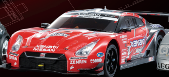
XANAVI NISMO GT-R 2008 No.32801XN