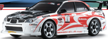
NEW インプレッサ No.12 クーバー・タイヤ/クロウフォード パフォーマンス No.30579ZSV (11月発売)