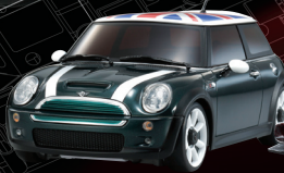
BMW ミニクーパース (メタリックグリーン) No.32701UMG

(ボディ/シャシーセットの内容) ●半完成シャシー ●フロントボディマウント組込済、塗装・マーキング工場完成プラス ティックボディ ●HM仕様パワーユニット(組込済) ●ナロートレッド(フロント)用ロア &アッパープレート、ステアリングタイロッド(組込済) ●ワイドトレッド(フロント)用 ロア&アッパープレート、ステアリングタイロッド(付属) ●調整用フロントサスペン ション ●6T・7T・8T・9Tピニオンギヤ ●ホイールレンチ ●ピニオンはすし工具 ●ベアリン グスティック ●予備ホイールナット