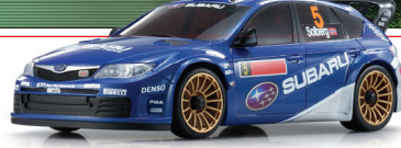
NEW ミニッツAWD MA-010 スバル インプレッサ WRC 2008 No.5 No.30577ZW5 ボディ/シャシーセット ¥19,950(税込)