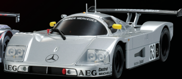
ザウバーメルセデス C9 No.63 LM 1989 No.32901SM