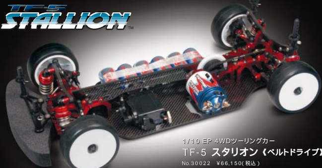
1/10 EP 4WD ツーリングカー TF-5 スタリオン (ベルトドライブ) No.30022 ¥66,150(税込)