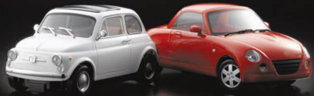
フィアット 500 No.30751Y(イエロー) No.30751W(ホワイト) ダイハツ コペン No.30752R(レッド) No.30752S(シルバー)

readysel ミニッツ リットシリーズ レディセット 各¥21,000(税込) NEW MODEL 全長約100mm (フィアット500)