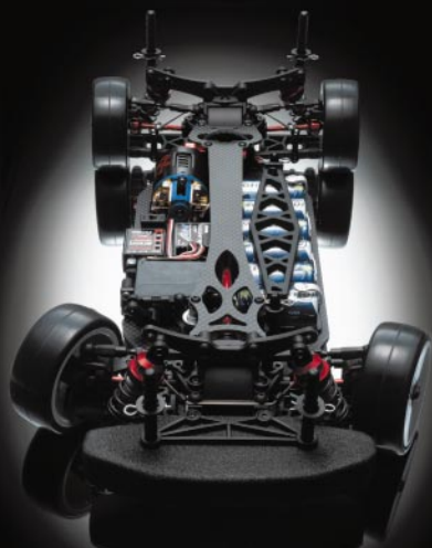
TF5 1/10 EP 4WD ツーリングカー TF-5 (シャフトドライブ) No.30021 ¥50,400(税込)

左右、前後、上下のねじりメントや応力、そして静・動両面での荷重にまで目を光らせた、究極のベルトドライブ4WDツーリングマシン誕生。幅広いセッティングパート、絶妙の姿勢制御を身につけて、世界の頂点を走る速さを獲得。パワフルなモディファイドモーターを搭載しても、シャーシが誇るゆとり設計が、ベルトならではの素直な操縦性を維持。あの足立伸之介選手も開発に携わった、勝つためのマシンが、いよいよサーキットへと出撃する。