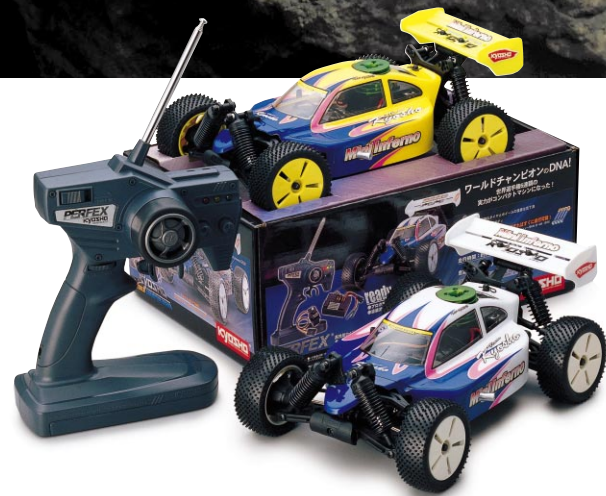
好評発売中 readyset R/C電動4WDレーシングバギー ハーフエイトシリーズ ミニインファerno レディセット No.30121T1(ホワイト)、No.30121T2(イエロー) 各¥23,100(税込)

電池(別売)の準備だけですぐに走行が楽しめる、すべて完成、すべてが付属のレディセット。世界チャンピオンマシンのノウハウが活かせる走行性能&操作性。380クラスモーター装備。路面を選ばない13デフ・フルタイム4WD。4輪独立サスペンション。ブレーキ&バック付高性能スピードコントロールアンプ採用。衝撃からメカを守るスリッパクラッチ付ギヤ装備。抜群の高速性能、最高速度21km/hの走り! 単3アルカリ乾電池で約35分間の走行を楽しめる!