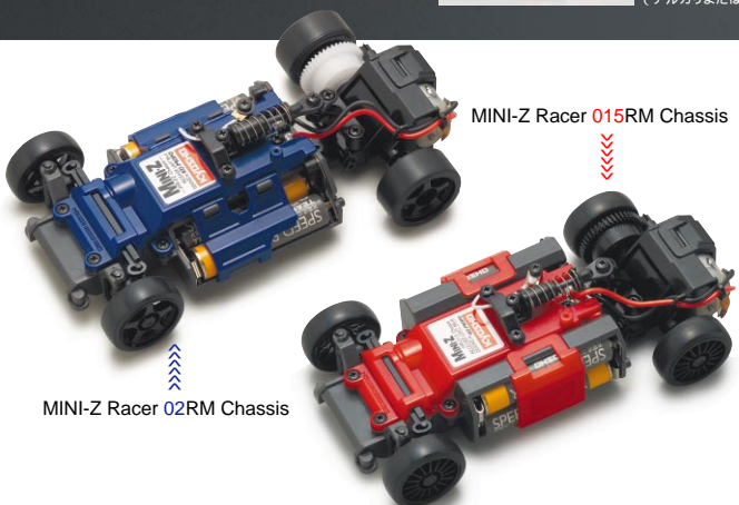
MINI-Z Racer 02RM Chassis