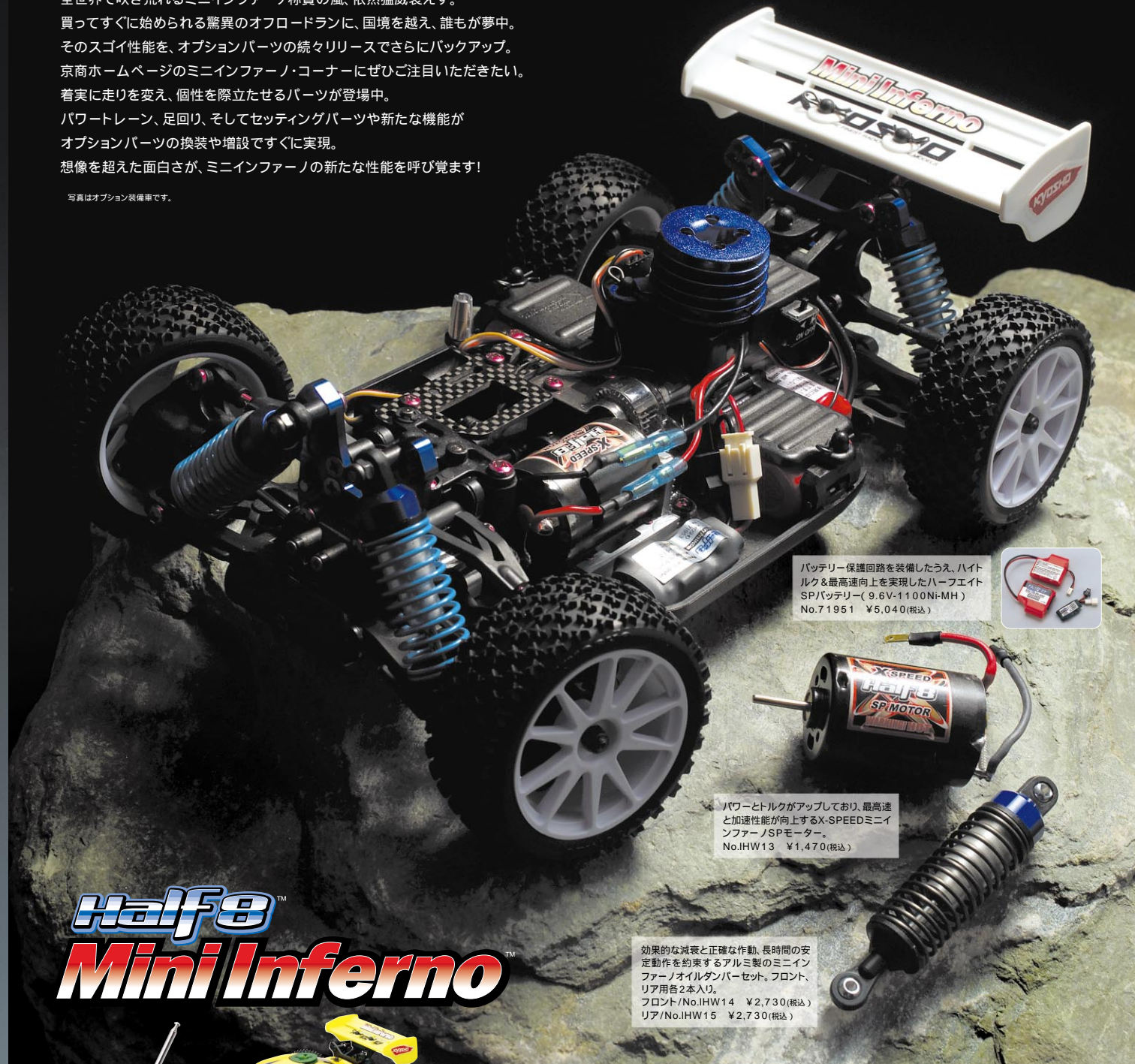
バッテリー保護回路を装備したうえ、ハイトルク&最高速向上を実現したハーフエイトSPバッテリー(9.6V・1100Ni-MH) No.71951 ¥5,040(税込)