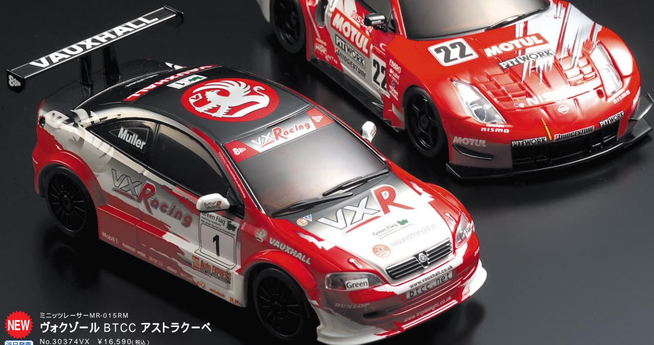
NEW ミニッツレーサー MR-015RM ヴォクソール BTCC アストラクーペ No.30374VX ¥16,590(税込) 近日発売

2004年度のJGTC(現スーパーGT)、そしてイギリスBTCCを戦った歴戦のツーリングカーが、海を越え、同じサーキットで雌雄を決する。そんな夢のようなレースが、今、ミニッツレーサーならかなえられる。実車チームから正式認定を受け、カラーリングはホンモノそのもの。スポンサーステッカーも克明再現。だからリアルさが違う。015シャシー、02シャシー共、もちろんすべて工場完成。あなたの走りに合わせたシャシーで、あるいはボディで選んで欲しい。GT選手権にプライベート参戦! そんな興奮が待っている。