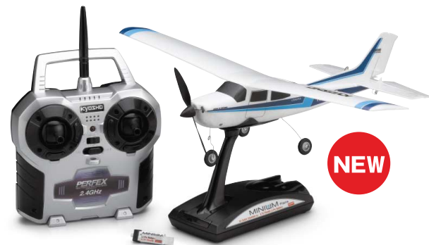
選べるカラータイプは3種類! Blue Green Red

readysel ® ミュームブレンシリーズ セスナ210 センチュリオン 《ミュームブレンレディセット》 初・中級者向 【ブルー No.10651RS-BL】 / 【グリーン No.10651RS-G】 / 【レッド No.10651RS-R】 《レディセット内容》 完全完成機体 3.7V-70mAhリチウムポリマーバッテリーパック 機体スタンド兼用専用オートカット急速充電器 2.4GHz帯デジタルトリム装備3ch2スティック送信機 飛行には別売の送信機用4本、充電器用4本の単3アルカリ乾電池が必要です。 《テクニカルデータ》 全長 / 325mm 全幅 / 380mm ギヤレシオ / 5.28:1 全備重量 / 約18g モーター / M6コアレスモーター 翼面積 / 2.2dm 2 翼型 / オリジナルカンパタイプ プロボ / 2.4GHz3ch-体型専用プロボ プロペラ / 95mm径