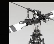
金属製Ver.M用ベル/ヒラー式シーソーヘッドを新開発。演技に適した操縦性を発揮。

《テクニカルデータ》 全長/1,160mm 全幅/210mm 全高/410mm 全備重量/約3,400g ギヤレシオ/9:1:5 エンジン/50クラス プロポ/自社ヘリ用6ch5サーボ1ジャイロ(別売) メインローター径/1,350mmクラス(別売)