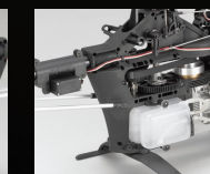
エキスパートの要望に対応し、激しい挙動に対応できるように80ccサブ燃料タンクを標準装備。

F3C演技対応のギヤ比を新設定。MMS(メカニカルミキシング)方式を、組み立てやすく高精度な仕上げの樹脂製モノコックフレーム。エルロン、エレベーター、ピッチコンは両引きリンクage。アルミダイキャストクラッチドラム、ハーフスワッシュプレート等の金属パーツを採用。半完成メインフレームとテールアッセンブリーで短時間で完成。受信機とバッテリー用独立メカボックスを装備。フルベアリング仕様。