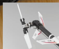
ひとクラス上のテールピッチユニット。

パワフルな飛行が可能な夢の電動ヘリを完全完成・ホバリング調整済みで実現。バッテリー充電とボディの製作だけですぐにフライトOK。アルミ削り出しセンターハブ、6mmジュラルミン製マストなど高剛性パーツを標準装備。洗練されたコレクティブピッチ(可変ピッチ)機構を装備。高い剛性で優れた操縦性を引き出す1mm厚カーボンメインフレームを採用。ニッケル水素用とリポ用の2種類のバッテリーホルダー付。