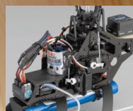
AF400BLSブラシレスモーターがパワフルな飛行を約束。

工場完成ホバリング調整済み機体 AF400BLS C/13/28ブラシレスモーター スカイビクトリー-BLS25アンブ 6ch送信機 4マイクログーボ 1ジャイロ AF12V-1100NiMHニッケル水素バッテリー DC12V急速充電器 ステップアップに伴い別購入のリポバッテリー使用時にも、アンブの設定変更のみで対応可能。 プロポ指定の電池は別売。