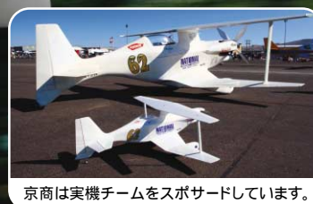
京商は実機チームをスポンサーしています。

NEW SQS .70 CLASS ENGINE POWERED SCALE AIRRACER PHANTOM 70